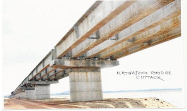
କାଠ ଯୋଡ଼ି ସେତୁ, କଟକ

ମୂଳ ଅନୁମୋଦିତ ଅଟକଳକୁ ନିରୀକ୍ଷଣ କଲାବେଳେ ଜଣାଗଲା ଯେ ଏହି ସେତୁର ଆକଳନ ସୁପର ଷ୍ଟ୍ରକ୍ଚରରେ ପିଏସ୍ସି ଏମ୍40 କାଷ୍ଟ ଇନ୍ ସିଗୁ ବଜୁ ଗାର୍ଡରକୁ ଧ୍ୟାନରେ ରଖାଯାଇଥିଲା । ଯଦ୍ୟପି ଠିକାଦାର ତାଙ୍କ ପ୍ରସ୍ତାବରେ ଯେକୌଣସି ଆର୍ଥିକ ବୃଦ୍ଧି ନକରି ନୂଆ ଆଇଟମ୍ରେ କାର୍ଯ୍ୟଟି ସଂପୂର୍ଣ୍ଣ କରିବା ପାଇଁ ଅନୁରୋଧ କରିଥିଲା, ତଥାପି ଠିକାଦାର ପିଏସ୍ସି ଏମ୍40 କାଷ୍ଟ ଅନ୍ ସିଗୁ କଂକ୍ରିଟ ବଜୁ ଗାର୍ଡର ପରିବର୍ତ୍ତେ ପିଏସ୍ସି-1 ଏମ୍50 ପ୍ରି କାଷ୍ଟ, ପ୍ରିଷ୍ଟ୍ରେସଡ୍ ଗାର୍ଡର କରିନେଇଥିଲେ ଏବଂ ଏହା ଆର୍ଥିକ ନିହିତାର୍ଥ ବର୍ଦ୍ଧିଭୁତ ଥିଲା । ବିଭାଗ ଦ୍ୱାରା ଅଧିକ 13.43 କୋଟି ଟଙ୍କା ଠିକାଦରକୁ ଲାଭାନ୍ୱିତ କରିବା ଏକ ଅନିୟମିତତା । ଯଦି ବିଭାଗ ତାର ମୂଳ ଅଟକଳ ବିଶେଷ ବିବରଣୀ ଅନୁଯାୟୀ କାର୍ଯ୍ୟ ସଂପାଦନ କରିଥାନ୍ତା ତେବେ ଏହି 13.43 କୋଟି ଟଙ୍କାର ଖର୍ଚ୍ଚକୁ ରୋକାଯାଇ ପାରିଥାନ୍ତା । ଏହି କାର୍ଯ୍ୟର ସଂପାଦିତ ସମୟ ମାର୍ଚ୍ଚ 2014 ଥିଲେ ବି ମାର୍ଚ୍ଚ 2016 ପର୍ଯ୍ୟନ୍ତ ମୋଟ ଆକଳନର 69 ପ୍ରତିଶତ କାର୍ଯ୍ୟ ସଂପାଦିତ ହୋଇଥିଲା ଓ ଠିକାଦାର 74.80 କୋଟି ଟଙ୍କା ପାଇଥିଲା ।