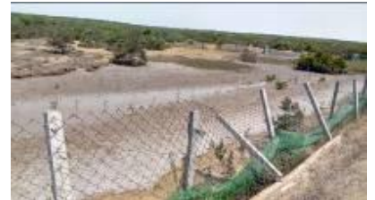
ଦେବେହୁନାରାୟଣପୁରଠାରେ ବୃକ୍ଷରୋପଣ ଓ ଘେରାଜାଲି