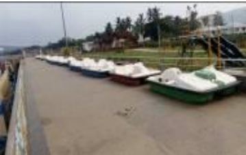
ବରକୁଳା ଠାରେ ଦୁଇଟି ସାଗ୍ ଥିବା ପେଡାଲ ବୋଟ

ଓଡ଼ିଶା ସରକାରଙ୍କ ମାର୍ଚ୍ଚ 2014ରେ ସମାପ୍ତ ବର୍ଷ ପାଇଁ ଭାରତର ମହାଲେଖା ନିୟନ୍ତ୍ରଣ ତଥା ମହାସମାକ୍ଷକଙ୍କ ସମାକ୍ଷା ପ୍ରତିବେଦନ ସଂଖ୍ୟା 3 (ପିଏସ୍‌ୟୁ) ଅନୁକ୍ରେମ 2.1.27ରେ 2.49 କୋଟି ଟଙ୍କାରେ ମନୋରଞ୍ଜନ ପାର୍କ ପାଇଁ କିଣାଯାଇଥିବା ବୋଟ୍, ଜେଟ୍ ସ୍କି/ ଡ୍ରାଗରସ୍କୁଟର ପରିଚ୍ଛଳନା ପ୍ରକଳ୍ପ ଯୋଜନା ଏବଂ ଆବଶ୍ୟକୀୟ ସଂରଚନା ଅଭାବ ଯୋଗୁଁ ଅବ୍ୟବହୃତ ହୋଇ ପଡ଼ି ରହିଥିବା ସଂପର୍କରେ ବ୍ୟକ୍ତ କରାଯାଇଥିଲା ।