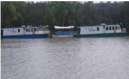
ଗଞ୍ଜାମାଳାରେ ବିଳାସପୂର୍ଣ୍ଣ ନୌକାର ରହଣା

ପୁନଶ୍ଚ, ପ୍ରମୁଖ ମୁଖ୍ୟ ବନ ସଂରକ୍ଷକ (ବନ୍ୟଜନ୍ତୁ) ଏବଂ ମୁଖ୍ୟ ବନ୍ୟଜନ୍ତୁ ରକ୍ଷକ ଓଡ଼ିଶାଙ୍କ ଅନୁଦେଶ ଅନୁସାରେ, ପର୍ଯ୍ୟଟନ ନୌକାଗୁଡ଼ିକର ଚାଳନା ପାଇଁ ଏଗୁଡ଼ିକ ପରିବହନ କରିବାକୁ ଥିବା ପର୍ଯ୍ୟଟକଙ୍କ ସଂଖ୍ୟା, ସେମାନେ ପ୍ରଦତ୍ତ କରିବାକୁ ଥିବା ଦେୟ ନାଉରାମାନଙ୍କ ମଜୁରିକୁ ମିଶାଇ ହେବାକୁ ଥିବା ଦୈନିକ ବ୍ୟୟ, ଦୈନିକ ବ୍ୟବହୃତ ହେବାକୁ ଥିବା ଇନ୍ଦନ ଏବଂ ବାର୍ଷିକ ଅବମୂଲ୍ୟମାନକୁ ହିସାବକୁ ନେଇ ବାହାର କରାଯାଇଥିବା ବାସ୍ତବିକ ଲାଭ ପ୍ରଭୃତିର ବିସ୍ତାରିତ ବିବରଣୀକୁ ନେଇ ଏକ ବ୍ୟବସାୟିକ ପ୍ରତିରୂପ ପ୍ରସ୍ତୁତ କରାଯିବାକୁ ଥିଲା ।