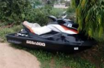
ରମ୍ପାଠାରେ ଜେଟ୍ ସ୍କି

ପୁନଶ୍ଚ, ସମାକ୍ଷାରେ ଦେଖାଗଲା ଯେ (ଜୁନ 2016) ଏକ ପରିଚ୍ଛଳନା ଯୋଜନା ତିଆରି କରିବା କାର୍ଯ୍ୟ ଏକ ଏଜେଣ୍ଟକୁ 11 ଲକ୍ଷ ଟଙ୍କାରେ ଦିଆଯାଇଥିଲା । ଏହି ଏଜେଣ୍ଟ ସେପ୍ଟେମ୍ବର 2014ରେ ଏକ ପରିଚ୍ଛଳନା ଯୋଜନା ପ୍ରସ୍ତୁତ କରିଥିଲେ ଏବଂ ଏଥିପାଇଁ 11.12 ଲକ୍ଷ ଟଙ୍କା ପ୍ରଦାନ କରାଯାଇଥିଲା । ଯୋଜନାଟି ଓଡ଼ିଶା ସରକାରଙ୍କ ଦ୍ଵାରା ଡିସେମ୍ବର 2015ରେ ଅନୁମୋଦିତ ହୋଇଥିଲା । କିନ୍ତୁ ଏହା ମଇ 2016 ସୁଦ୍ଧା ପର୍ଯ୍ୟନ୍ତ ବିଭାଗ ଦ୍ଵାରା କାର୍ଯ୍ୟକ୍ଷମ କରାଯାଇ ପାରିନଥିଲା । ପରିଚ୍ଛଳନା ଯୋଜନା ଅଭାବରେ ଓଡ଼ିଶା ପର୍ଯ୍ୟଟନ ଉନ୍ନୟନ ନିଗମ (ଓଟିଡିସି) ଦ୍ଵାରା ନଭେମ୍ବର 2013 ରୁ ଫେବୃଆରୀ