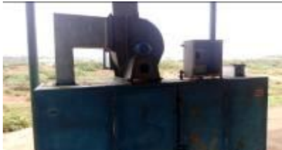
ଇଲେକ୍ଟ୍ରିକାଲ ଉପକରଣ ବୋରି ହୋଇଥିବା ଡ୍ରାୟର

ଉପରୋକ୍ତ ଉଦ୍ଦେଶ୍ୟ ସହତି 150 ଟି ସୌର ଡ୍ରାୟରକୁ ଯୋଗାଇବା ଏବଂ ସଂସ୍ଥାପନ କରିବା କାର୍ଯ୍ୟ ଜୁଲାଇ 2013 ମଧ୍ୟରେ ସଂପୂର୍ଣ୍ଣ କରିବା ପାଇଁ ଏବଂ ତିନି ବର୍ଷ ପାଇଁ ବାର୍ଷିକ ଲକ୍ଷଣାବେକ୍ଷଣ ମୂଲ୍ୟ ଅନ୍ତର୍ଭୁକ୍ତ ଥାଇ 8.34 କୋଟି ଟଙ୍କାରେ ଏକ ଏଜେନ୍ଟକୁ ଟେଣ୍ଡର ଜରିଆରେ ପ୍ରଦାନ କରାଗଲା (ଅକ୍ଟୋବର 2012) । ତେବେ 10 ଟି ଯୁନିଟ୍ (7 ଟି ପୁରୀରେ ଏବଂ 3 ଟି ବାଲୁଗାଁରେ) ସଂସ୍ଥାପନ ପରେ ମହ୍ୟ ବିଭାଗ, ଆଇସିଜେଡ୍‌ଏମ୍‌ପି ର ନୋଡାଲ ଅଧିକାରୀ ନିରୀକ୍ଷଣ (ସେପ୍ଟେମ୍ବର 2013) ସମୟରେ ଅବଲୋକନ କଲେ ଯେ ପ୍ରଭାବ