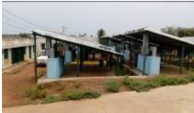
ଗୋପାଳପୁର ଠାରେ 30ଟି ଡ୍ରାୟର

ଉପକୂଳ ଜନସଂଖ୍ୟା ମାନଙ୍କ ମଧ୍ୟରେ କେଉଟମାନଙ୍କ ସଂଖ୍ୟା ଖୁବ୍ ଅଧିକ । ପ୍ରତ୍ୟେକ ବର୍ଷ ନଭେମ୍ବର 1 ଠାରୁ ମଇ 31 ପର୍ଯ୍ୟନ୍ତ ଭିତର କନିକା ବନ୍ୟଜନ୍ତୁ ଅଭୟାରଣ୍ୟର ଗହୀରମଥା ଠାରୁ 20 କିଲୋମିଟର ବ୍ୟାସାର୍ଦ୍ଧ ବିଶିଷ୍ଟ କଇଁଛ ସମାବେଶ କ୍ଷେତ୍ରରେ ମାଛଧରା ନିଷେଧ କରାଯାଏ, ଯାହାକି କେଉଟମାନଙ୍କର ଜୀବିକା ନିର୍ବାହ ଉପରେ ପ୍ରତିକୂଳ ପ୍ରଭାବ ପକାଏ । ଏହି ସମୟ ମଧ୍ୟରେ ମାଛଧରା ଏବଂ ସହଯୋଗୀ ଗୋଷ୍ଠୀ ଗୁଡ଼ିକୁ ଉଚିତ୍ ଜୀବିକା ସୁରକ୍ଷା ଯୋଗାଇଦେବା ଉଦ୍ଦେଶ୍ୟରେ ଆଇସିଜେଡ୍‌ଏମ୍‌ପି ଅଧିନରେ ଗୋଟିଏ ଗତିବିଧି ଥିଲା ମହ୍ୟଜାତ ଦ୍ରବ୍ୟରେ ମୂଲ୍ୟ ଯୋଗ କରିବା । ଏଥି ନିମନ୍ତେ ମୁଖ୍ୟତଃ କେଉଟୁଣୀମାନଙ୍କୁ ଯେଉଁମାନେକି ପାରମ୍ପରିକ ମାଛଧରା ଅଞ୍ଚଳରେ ସାଭାବିକତଃ କିଣାବିକା ଦାୟିତ୍ୱ ନେଇଥାଆନ୍ତି, ସଂପୃକ୍ତ କରାଇ ସ୍ୱୟଂ ସହାୟକ ଗୋଷ୍ଠୀ ଗଠନ କରାଯିବାର ଥିଲା । ଏଥିସହ ଉପନ୍ନ ଦ୍ରବ୍ୟର କିଣାବିକା ପାଇଁ, ଏହି ସ୍ୱୟଂ ସହାୟକ ଗୋଷ୍ଠୀ ସହ ପ୍ରଯୁଜ୍ୟ ଏଜେନ୍ତାମାନଙ୍କୁ ସଂଯୋଗ କରିବାର ଥିଲା । ବିଶଦ ପ୍ରକଳ୍ପ ବିବୃତିରେ ଏହା ଅଟକଳ କରାଯାଇଥିଲା ଯେ, ପ୍ରତ୍ୟେକ ସ୍ୱୟଂ ସହାୟକ ଗୋଷ୍ଠୀ ବର୍ଷକୁ 3 ଲକ୍ଷ ଟଙ୍କା ଲେଖାଏଁ ଲାଭ କରିବେ ।