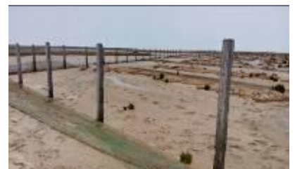
କରଦିଆଠାରେ ବୃକ୍ଷରୋପଣ ଓ ଘେରାଜାଲି

କଂକ୍ରିଟ୍ ସମ୍ପୂର୍ଣ୍ଣ ଏବଂ ପ୍ଲାଷ୍ଟିକ୍ ଜାଲି ସଂସ୍ଥାପନ, ମହ୍ୟ ହାତ ପ୍ରଣାଳୀ ଖୋଲିବା ଏବଂ 138 ହେକ୍ଟର ଭୂମି ଉପରେ ବୃକ୍ଷରୋପଣ କାର୍ଯ୍ୟ ଡିସେମ୍ବର 2011 ଠାରୁ ଜୁନ 2015 ମଧ୍ୟରେ ଦୁଇଟି ପର୍ଯ୍ୟାୟରେ 2.80 କୋଟି ଟଙ୍କା ମୂଲ୍ୟର 19 ଗୋଟି ରୁକ୍ମି ଦ୍ୱାରା ହାତକୁ ନିଆଗଲା । ଏହି କାର୍ଯ୍ୟଗୁଡ଼ିକ ନଭେମ୍ବର 2012 ଏବଂ ଡିସେମ୍ବର 2015 ମଧ୍ୟରେ 2.38 କୋଟି ଟଙ୍କା ବ୍ୟୟରେ ସଂପୂର୍ଣ୍ଣ ହୋଇଥିଲା ।