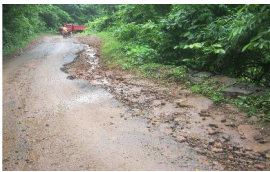
ଆରଡି 9.0 କିମି ଠାରେ ନରସିଂହପୁର-ହିନ୍ଦୋଳ ରାସ୍ତା