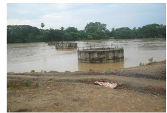
ବଡ଼ଚଣା-ବାଲିଚନ୍ଦ୍ରପୁର ରାସ୍ତାର ଏଟଏଲ୍ ସେତୁ 3 କିମି

ଅବସ୍ଥିତ ବ୍ରିଜଟି ଡିସେମ୍ବର 2015ରେ 18.35 କୋଟି ଟଙ୍କା ଖର୍ଚ୍ଚରେ ସମାପ୍ତ ହୋଇଥିଲା । ଜମି ଅର୍ପଣ ପ୍ରସ୍ତାବ ଯାଜପୁର ଏଲଏଓ କୁ ଯଦିଓ ଡିସେମ୍ବର 2015ରେ ନିବେଦନ କରିଥିଲେ କିନ୍ତୁ ଅଧିକାରୀଙ୍କୁ ନଭେମ୍ବର 2010ରେ ଜାରି କରିଥିଲା । ଏହା ଅବଲୋକନ ହେଲା ଯେ ବ୍ରିଜର ଉଭୟ ପାର୍ଶ୍ୱର ପ୍ରବେଶ ରାସ୍ତା ଏବଂ ଆବ୍ୟର୍ତ୍ତମେଣ୍ଟ୍ ପାଇଁ ଆବଶ୍ୟକ ଥିବା ଜମି ଉପଲବ୍ଧି ନ ଥିବା କାରଣରୁ ଠିକାଦାର କାର୍ଯ୍ୟ ଟିକ୍କୁ ପରିତ୍ୟକ୍ତ କରିଥିଲେ (ଜୁଲାଇ 2013) । ଆବଶ୍ୟକ ଥିବା ଜମି ବ୍ୟବସ୍ଥା ପାଇଁ ବିଭାଜନ ଅକ୍ଟୋବର କାର୍ଯ୍ୟ ହୋଇଥିଲା । 3 କିମିରେ ଥିବା ବ୍ରିଜ 5.47 କୋଟି ଟଙ୍କାରେ ଅସମ୍ପୂର୍ଣ୍ଣ ରହିଥିଲା । ଯେହେତୁ ଗୋଟିଏ ବ୍ରିଜ ସମ୍ପୂର୍ଣ୍ଣ ହୋଇପାରି ନଥିଲା । ତେଣୁ ଉପରୋକ୍ତ ରାସ୍ତା ସଂଯୋଗ ହୋଇନଥିବା ଦେଖାଦେଲା ଏବଂ 23.82 କୋଟି ଟଙ୍କା ଖର୍ଚ୍ଚ ହେଲାପରେ ମଧ୍ୟ ଆବଶ୍ୟକ ସଂଯୋଗ କରଣର ବ୍ୟବସ୍ଥା ହୋଇପାରିନଥିଲା ।