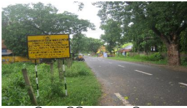
ଆରଡି 7.0 କିମି ଠାରେ ନରସିଂହପୁର-ହିନ୍ଦୋଳ ରାସ୍ତା

ଆଂଶିକ ଭାବରେ ସଂପୂର୍ଣ୍ଣ ହୋଇଥିବା ଏବଂ ଆଦୌ ଉନ୍ନତିକରଣ ହୋଇନଥିବା ଅଂଶ ଗୁଡ଼ିକର ବିଶଦ ବିବରଣୀ ପରିଶିଷ୍ଟ 2.1.1 ରେ ଦର୍ଶାଯାଇଅଛି ।