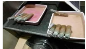
ପ୍ରଶିକ୍ଷଣ କେନ୍ଦ୍ରରେ ନଅଟି ସେନସରସ

ବିଶଦ ପ୍ରକଳ୍ପ ବିଦୃତି (ଡିପିଆର) ନିର୍ଦ୍ଧାରଣ କରିଥିଲା ଯେ ଲବଣତା, ତାପକ୍ରିୟା, ପରିବାହିତା, ବିଘଟିତ ଅମ୍ଳଜାନ, ପିଏଚ୍, ପଙ୍କଜତା, ପତ୍ରହରିତ ଏବଂ ନୀଳ ସରୁଜ ଶୈବାଳ ଉପରେ ବାସ୍ତବ ସମୟ ଆଧାରରେ ନିରବଚ୍ଛିନ୍ନ ତଥ୍ୟ ପାଇବା ଉଦ୍ଦେଶ୍ୟରେ ଚିଲିକା ହ୍ରଦର ବିଭିନ୍ନ ପରିବେଶ ଭିତ୍ତିକ ସେକ୍ଟରରେ ଦ୍ରବ୍ୟଗୁଣ ଖାପନ ଯନ୍ତ୍ର ସଂସ୍ଥାପନ କରାଯିବ । ଏହି ଦ୍ରବ୍ୟଗୁଣ ଖାପନ ଯନ୍ତ୍ର ଗୁଡ଼ିକ ଭାସମାନ ତାପବନ୍ଧ ମଧ୍ୟରେ ଥିବା ସକ୍ଷ 30 ରେ ସ୍ଥାପନ କରାହେବ ଯାହାକି ମୋବାଇଲ ନିମିତ୍ତ ପାର୍ସିବ ପକ୍ଷରେ ରେଡିଓ ବା ବେତାର ଦ୍ୱାରା ଡାଟାଲିଣ୍ଡ ଗବେଷଣା ଏବଂ ପ୍ରଶିକ୍ଷଣ କେନ୍ଦ୍ରରେ ଅବସ୍ଥିତ ପ୍ରତି ରୁପାନ୍ତରଣ ସଂଗତାକୁ ତଥ୍ୟ ସଞ୍ଚାରଣ କରିବ । ଏହା, ପରିମାପ ଗୁଡ଼ିକର ପର୍ଯ୍ୟାଲୋଚନା ସମୟରେ ମାନବୀୟ ତୃଟିକୁ ନିରାକରଣ କରିବ । ଦଶଟି ଜଳ ଗୁଣବତ୍ତା ପର୍ଯ୍ୟାଲୋଚନା ବନ୍ଧ ପ୍ରଣାଳୀକୁ କାର୍ଯ୍ୟରେ ଅଗ୍ରସର ହେବା ପାଇଁ ନୋଟିସ ପ୍ରାପ୍ତ ହେବାର 12 ସପ୍ତାହ ମଧ୍ୟରେ