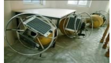
ତବ୍ଲୁଆରଟିସିର ଛାତରେ ଚିନିଟି ବନ୍ଧ

ଯୋଗାଇବା, ସ୍ଥାପନ କରିବା, କ୍ରମାଙ୍କନ କେନ୍ଦ୍ର ପ୍ରତିଷ୍ଠା କରିବା, କର୍ମଚାରୀ ମାନଙ୍କୁ ପ୍ରଶିକ୍ଷଣ ଦେବା ଏବଂ ବାର୍ଷିକ ରକ୍ଷଣା ବେକ୍ଷଣ ଦେୟ ଇତ୍ୟାଦି କାର୍ଯ୍ୟ ଚିଲିକା ଉନ୍ନୟନ କର୍ତ୍ତୃପକ୍ଷ ଏକ ଏଜେନସିକୁ 3.17 କୋଟି ଟଙ୍କାରେ ପ୍ରଦାନ କଲେ (ମାର୍ଚ୍ଚ 2012) । ସେହି ଏଜେନସି ବନ୍ଧ ଗୁଡ଼ିକୁ 10 ଜୁଲାଇ 2012 ସୁଦ୍ଧା ଯୋଗାଇ