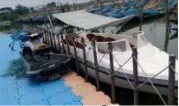
ରମ୍ପାଠାରେ ଦୁତଗାମୀ ନୌକା ଓ ଜେଟ୍ ସ୍କି